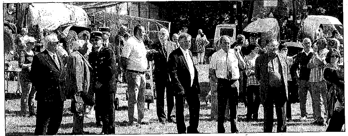
La visite inaugurale