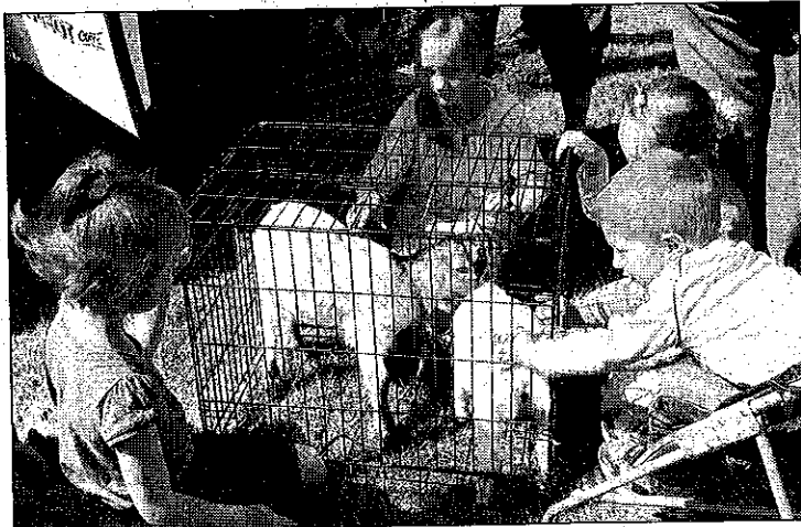
Beaucoup de succès pour ces chevreaux

Les membres du syndicat d'initiatives organisateur de la manifestation se sont réjouis de la bonne fréquentation, encore cette année, ceci grâce aux nombreux bénévoles qui contribuent au bon déroulement de cette foire si conviviale et familiale.