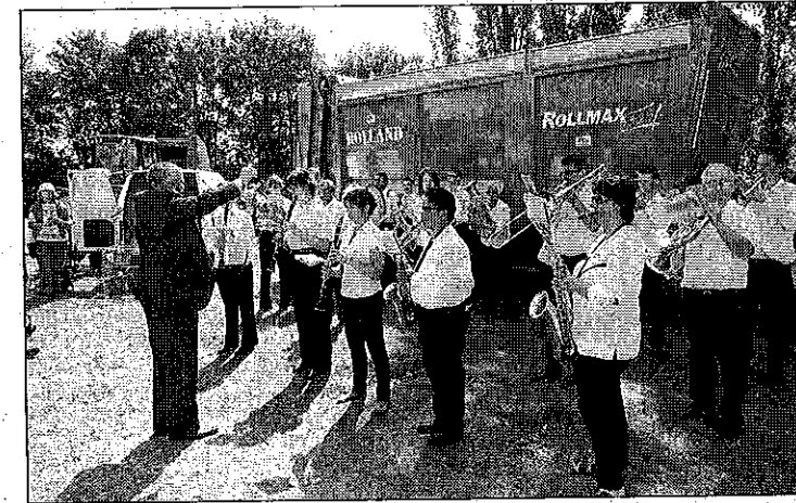
L'Union musicale de Châtillon-sur-Loire